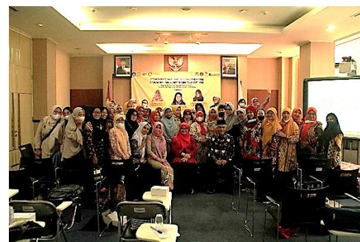
Gambar 1 & 2 Acara sosialisasi kebijakan hukum dan perlindungan hak anak bersama KPAI