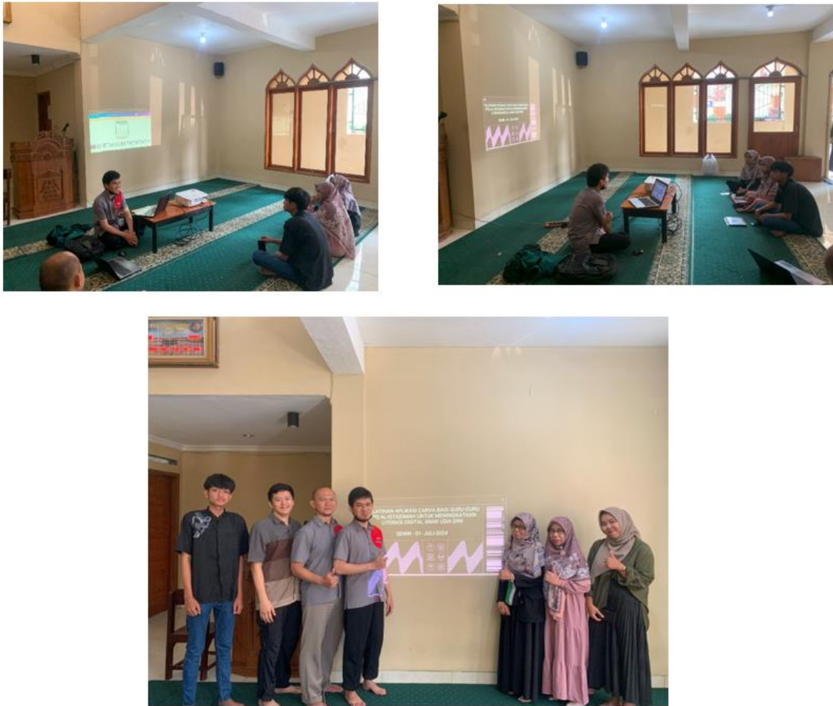
Gambar 2. Dokumentasi rangkaian kegiatan pengabdian masyarakat pada TPQ Al-Istiqomah