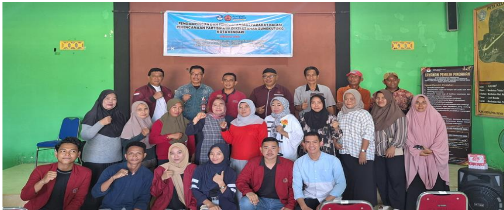
Gambar 3 ; Dokumentasi Pada Saat Pelatihan Perencanaan

Untuk pelatihan bagi UMKM di Kelurahan Bungkutoko dalam mengolah Hasil perikanan dan pertanian, menjadi produk bernilai tambah serta memperkenalkan dasar-dasar kewirausahaan.