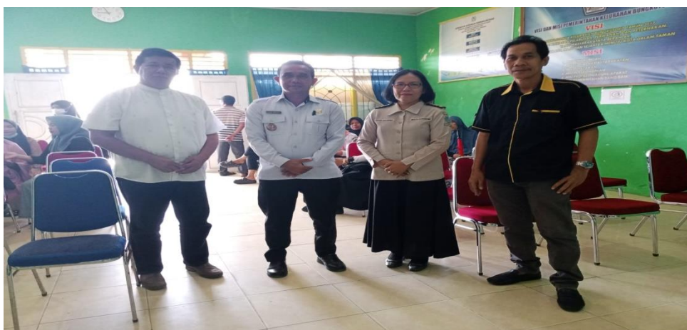
Gambar 2 : Dokumentasi Pada Saat Sosialisasi