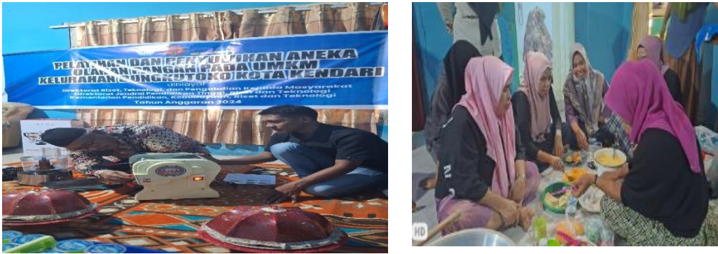
Gambar 4 : Dokumentasi Pada Saat pelatihan UMKM