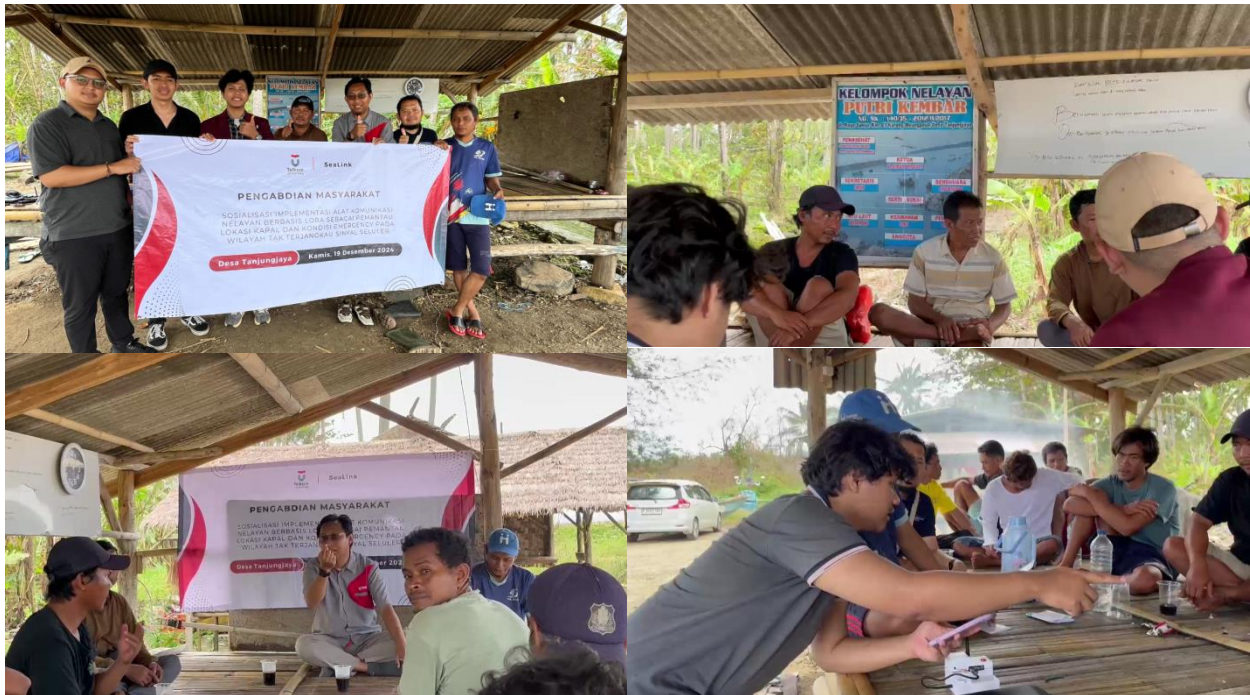
Gambar 3. Dokumentasi pelaksanaan kegiatan