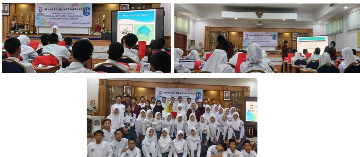
Gambar 1. Kegiatan Pelatihan Konsep Kalkulus Menggunakan Software di SMA NEGERI 8 BANDUNG

Mitra berpartisipasi dengan cara menyediakan auditorium untuk pelatihan. Auditorium sudah dilengkapi dengan infokus dan kelengkapan lainnya. Peserta yang berpartisipasi terdiri dari 10 orang guru dan 30 orang siswa SMA. Setiap peserta diwajibkan untuk membawa laptop sehingga memudahkan mereka untuk memahami materi pelatihan.