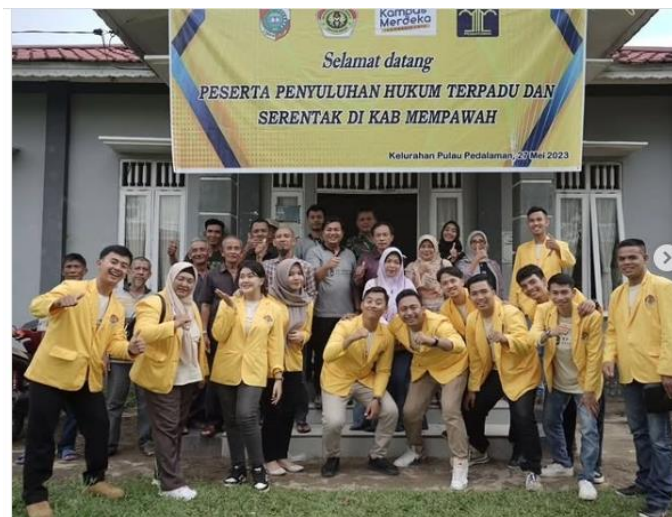
Gambar 2. Kegiatan senada dilakukan juga di lokasi yang berbeda