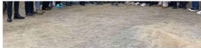
Gambar 1 . Kegiatan Pembukaan KP-KKN oleh Kepala Desa Parit Banjar