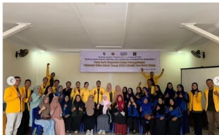
Gambar 3. Pengarahan Kegiatan Penyuluhan Hukum Serentak Se-Kabupaten Bengkayang